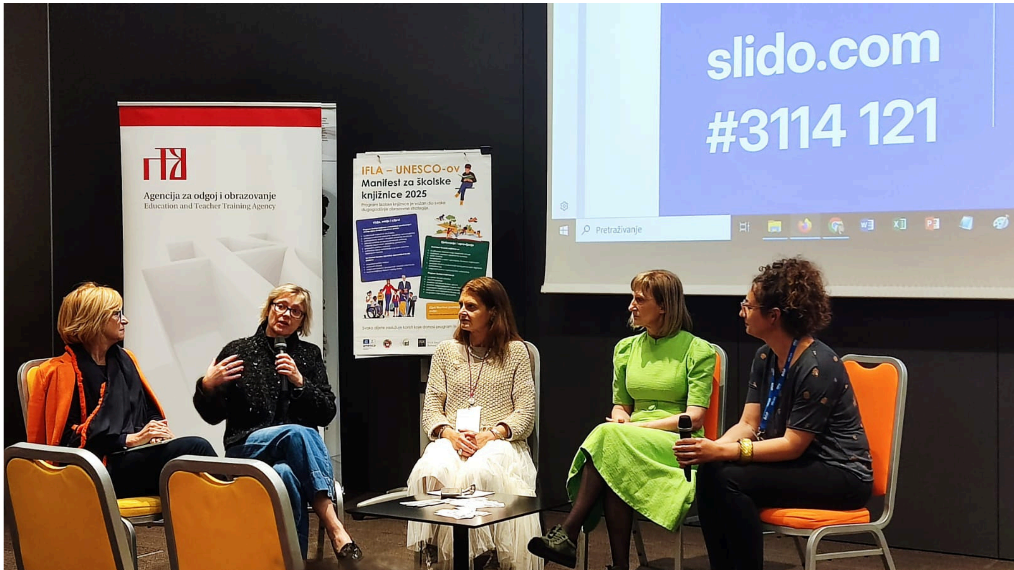
Panel o izazovima školskih knjižničara u hrvatskim školama